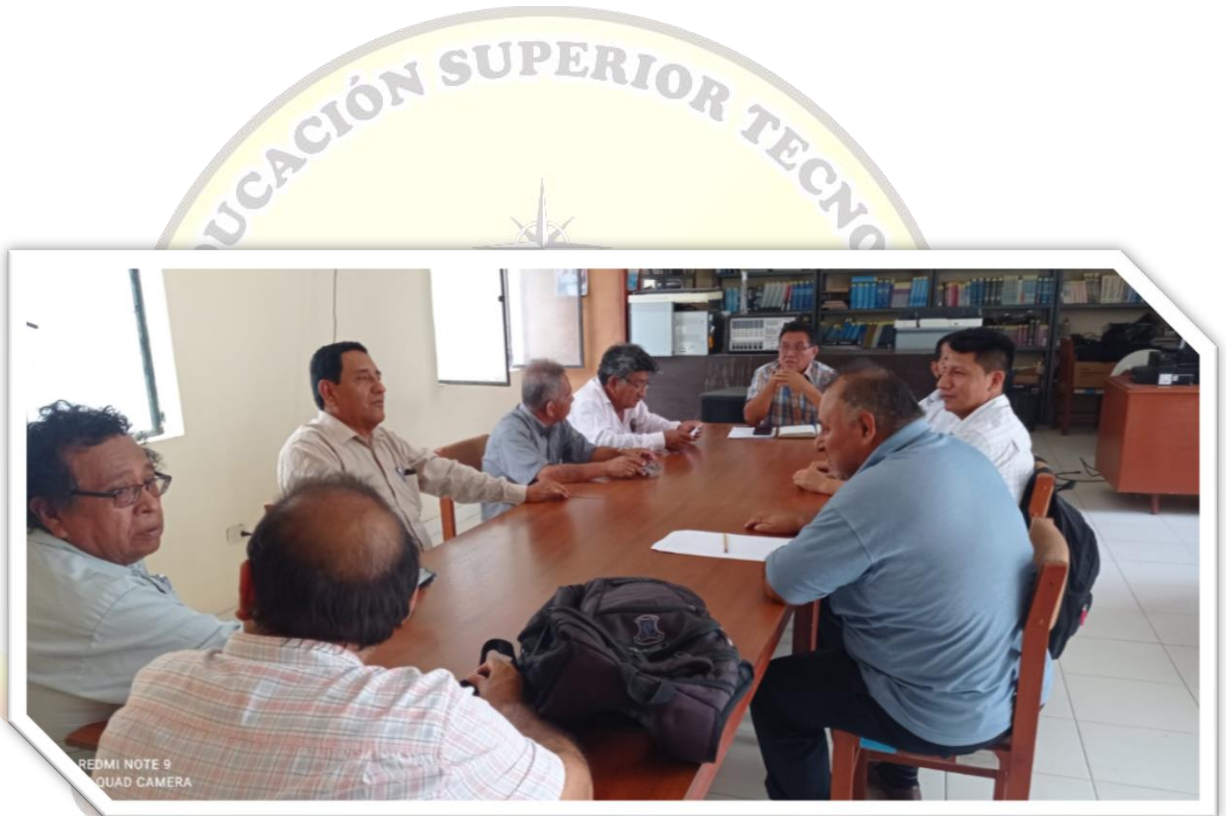
Equipo de gestores trabajando el Plan Anual de Trabajo 2025.